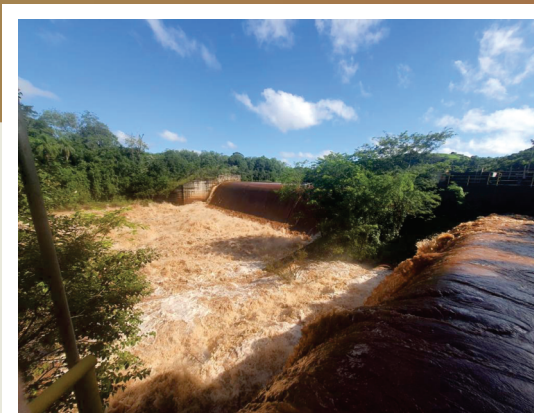
Barragem Caa yari